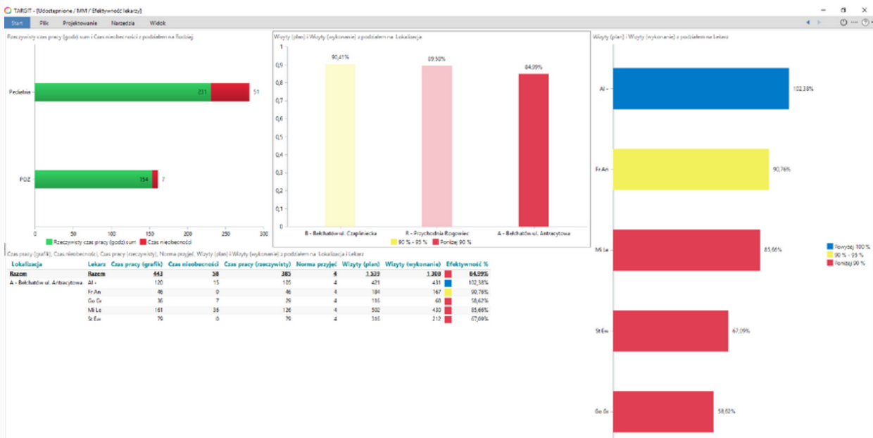
Dashbord 3: Efektywność pracy lekarzy