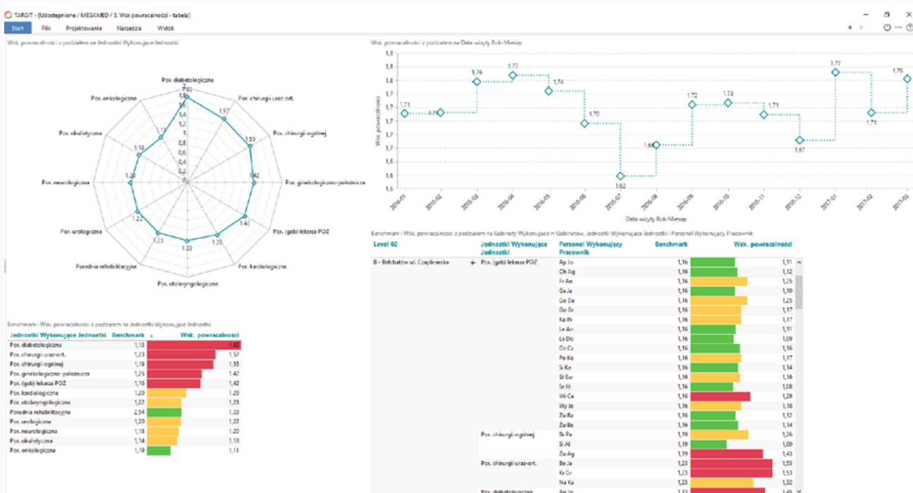
Dashboard 2: Powracalność pacjentów (z podziałem na specjalizacje, gabinety oraz pracowników).